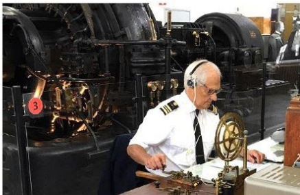
Historical transmitter SAQ Alexanderson Alternator